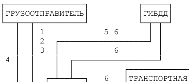
Схема документооборота при перевозке опасных грузов, не относящихся к классу особо опасных, приведена на рис. 2.

Кроме перевозок непосредственно опасных грузов транспортными средствами перевозится порожняя тара из-под них на тех же основаниях, что и находившийся в ней опасный груз, с соблюдением всех требований и правил безопасности. В товарно-транспортной накладной на перевозку неочищенной порожней тары делаются отметки с наименованием ранее перевозимого опасного груза и его номер по списку ООН (рекомендуется эти данные заносить красным цветом). Порожнюю тару из-под опасных грузов очищают грузоотправители-грузополучатели. Перевозку полностью очищенной тары, о чем делается отметка в товарно-транспортной накладной "Тара очищена" (красным цветом), осуществляют на общих основаниях как неопасный груз.